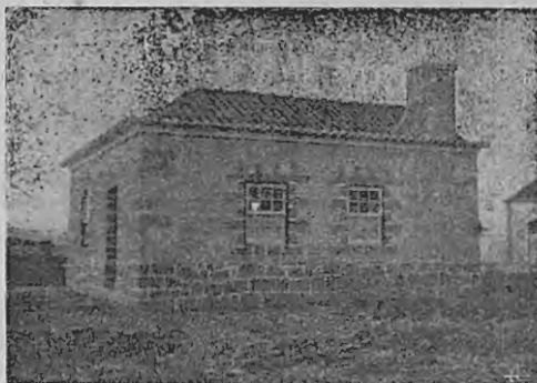
Tojal; ao lado desta, mais três estão a subir. No plano estão oito, que esperam quem levante o dedo.