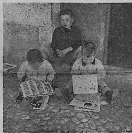
Tojal: "os batatas, Domingo." Fatinho de ver a Deus. Cumprido o preceito, descansol Quem não sabe ler, vê bonecos.

Posto isto, que margem de acção resta ao centro para a sua actuação seja recomendável e benéfica? Como regra o centro deve providenciar para que não falte à família aquilo que ela por si mesma, mesmo com alguma dificuldade, não pode obter nem prescindir. Se há famílias sem habitação ajuda-las na renda de casa ou procurar construir-lhas (o Património dos Pobres.); fornecer-lhes, roupas, remédios; obter-lhes subsídio de invalidez, emprego, etc. etc. Por isso eu admiro a actividade das Conferências que, sem espanto, actuam directamente sobre a família e lhe levam o conforto moral, a formação espiritual e o possível auxílio material. São verdadeiros centros de assistência embora sem sede, sem personalidade jurídica, sem subsídios, só porque não é fiscalizável a sua actuação. Admiro igualmente as Criaditas dos Pobres que indo de casa em casa, limpam, enfeitam, educam, regeneram. Do mesmo modo vivem sem subsídios porque é demasiado apagada a sua actividade para merecerem uma esmola política. Isso é para quem faz barulho. Mas voltemos ao Centro. Infelizmente nem todas as famílias se encontram legalmente constituídas, completas, capazes de