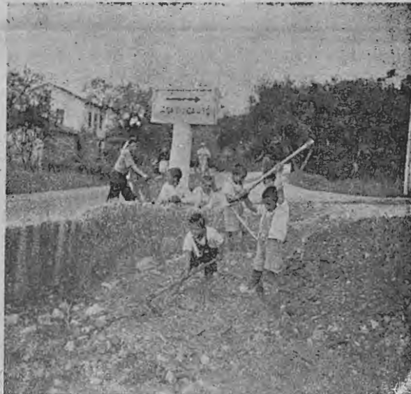
Miranda: isto é a Casa do Gaiato. Carros, pás, picaretas. O trabalho! Sem trabalho não há regeneração.

80 do assinante 3767 pelas intenções mencionadas. Mais 100 de uma viuva e mãe, pelo seu marido «socialista e grande admirador da obra do P.º Américo, que sempre condenou o dinheiro mal gasto». Mais 50$ de Vila Real de Santo António em cumprimento duma promessa, e 1000 do Porto, e três pinoros enchovais de criança, de Abrantes. Mais cem duma promessa, um fato usado; outro. Aqui os fatos são disputados renhidamente. Mais poloveres e gravatas. O Caneco fez agora 19, anos teve oferta de 5 e pôlas todas ao pescoço! «Isto é a Casa do Gaiato».